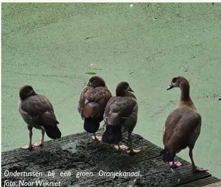
Ondertussen bij een groen Oranjekanaal.